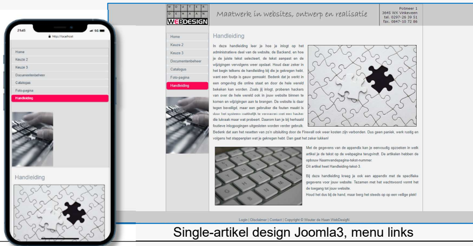
Single-artikel design Joomla3, menu links